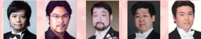
元帥夫人執事 吉田連 ファニーナル執事 大川信之 公証人 畠山 茂 料理屋の主人 竹内公一 テノール歌手 菅野 敦